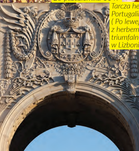
Tarcza herbowa Portugalii. (Po lewej; płaskorzeźba z herbem na tuku triumfalnym w Lizbonie.)

Pięć kropek na każdej małej tarczy oznacza pięć ran Zbawiciela. Krzyż złożony z pięciu tarcz w herbie został umieszczony przez króla Alfonsa na pamiątkę jego pięciu zwycięstw nad wielokrotnie silniejszymi wojskami muzułmanów. Portugalia jest jedynym krajem świata, który w swoim współczesnym godle zachował symbole pięciu ran Chrystusa.