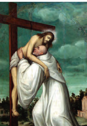
Chrystus obejmuje świętego Bernarda z Clairvaux.