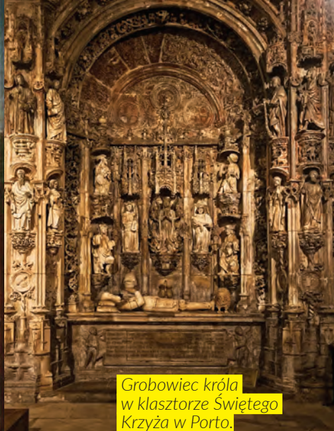
Grobowiec króla w klasztorze Świętego Krzyża w Porto.