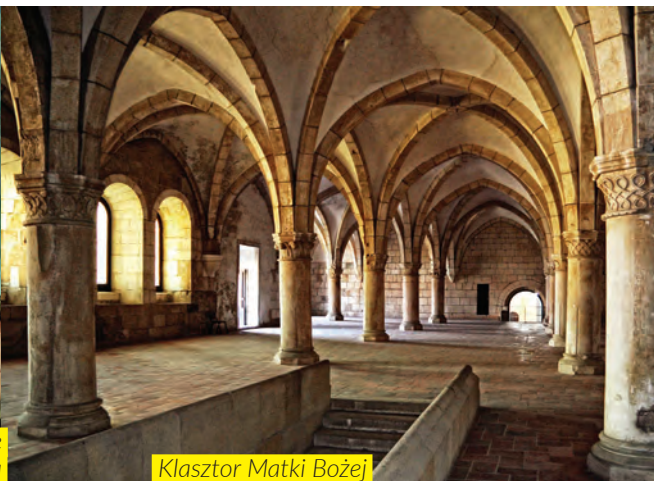
Klasztor Matki Bożej w Alcobaça.

twierdzą Santarém i ją zajmie, to wybuduje klasztor, w którym mnisi do końca świata będą śpiewać na chwałę Najświętszej Maryi Panny. Santarém zostało zdobyte, a Afonso wypełnił swe ślubowanie: na ziemię portugalską sprowadził mnichów cysterskich. Do ich wysłania św. Bernard z Clairvaux został przynaglony przez samo Niebo! (Ciekawe, że wątki objawień przewijają się przez dzieje Portugalii aż po Fatimę i dalej, po współczesność.) Mnisi zamieszkali w Mosteiro de Santa Maria de Alcobaça: klasztorze Matki Bożej w Alcobaça.