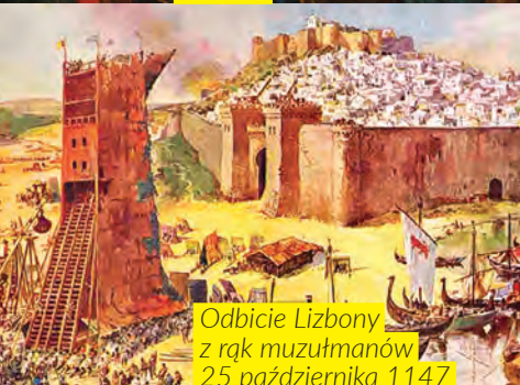
Odbicie Lizbony z rąk muzułmanów 25 października 1147

Pięć kropek na każdej małej tarczy oznacza pięć ran Zbawiciela. Krzyż złożony z pięciu tarcz w herbie został umieszczony przez króla Alfonsa na pamiątkę jego pięciu zwycięstw nad wielokrotnie silniejszymi wojskami muzułmanów. Portugalia jest jedynym krajem świata, który w swoim współczesnym godle zachował symbole pięciu ran Chrystusa.