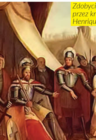
Zdobycie Lizbony przez króla Afonso Henriquesa.