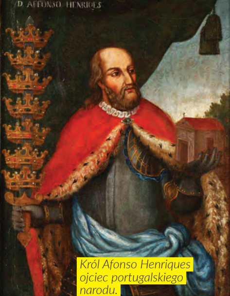
Król Afonso Henriques ojciec portugalskiego narodu.