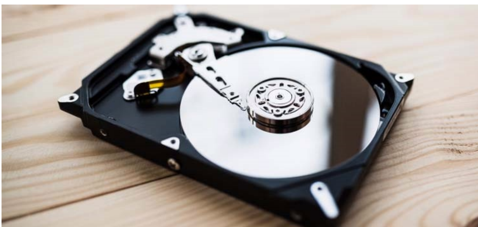
Rysunek 2.4 Na zdjęciu dysk HDD.

W przypadku dysków warto zwrócić uwagę na: