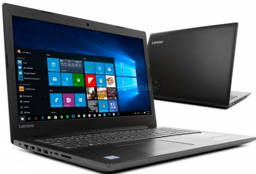
Rysunek 2.6 Na zdjęciu laptop Lenovo Ideapad 320-15IKB.