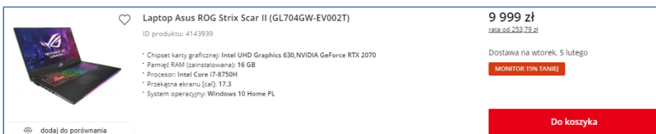
Rysunek 2.2 Na obrazku pokazany jeden z najdroższych laptopów.