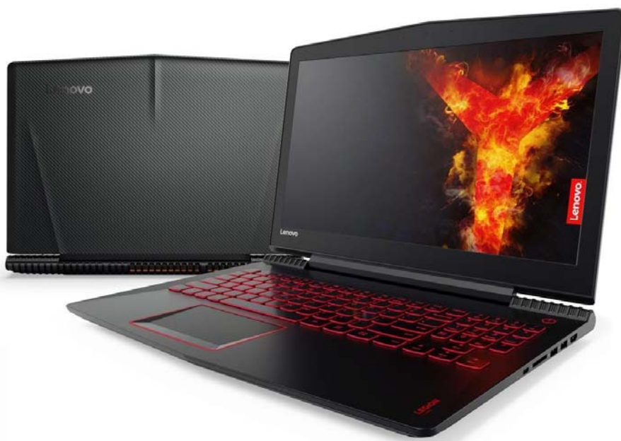
Rysunek 2.7 Na zdjęciu laptop Lenovo Legion Y520-15IKB.

W dzisiejszych czasach w Internecie możemy kupić praktycznie wszystko, lecz czy zawsze warto? Zamawiając coś w Internecie musimy wziąć pod uwagę że nasz towar może być uszkodzony lub niekompletny lecz możemy go do 14 dni zwrócić bez podania przyczyny. Natomiast kupując w sklepie stacjonarnym mamy fizyczny kontakt ze sprzętem i wiemy, że nie będzie on uszkodzony lub niekompletny a w razie wypadku mamy na niego gwarancję.