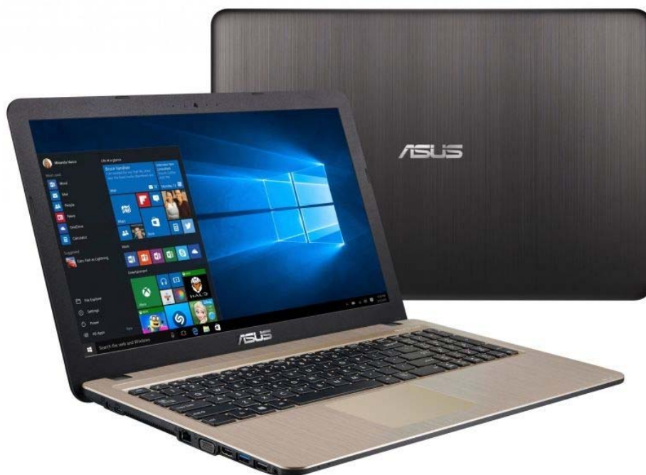
Rysunek 2.5 Na rysunku przedstawiony wcześniej wspomniany Laptop.