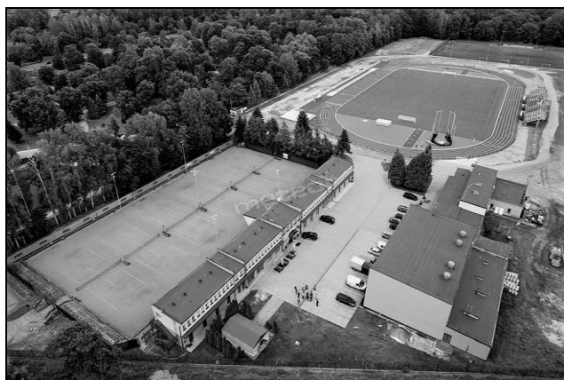
Fot. 1. Stadion ULKS MOSiR Sieradz

Najbardziej ubogim zagospodarowaniem sportowym w 2016 r. charakteryzował się stadion w Tomaszowie Mazowieckim. Znajdowało się w nim jedno boisko do gry, które miało sztuczną nawierzchnię, dzięki czemu treningi mogły być prowadzone zarówno latem, jak i wtedy, kiedy na płycie boiska leżał śnieg. Zdecydowanie najlepszą infrastrukturę piłkarską posiadał SMS Łódź. Tutaj piłkarki w jednym miejscu miały zarówno bazę treningową, jak i szkołę oraz odnowę biologiczną, lekarza i salę do rehabilitacji. Najbogatszą infrastrukturą sportową wyróżniał się natomiast MOSiR, mieszczący się w Sieradzu (fot. 1), z którego boisk piłkarki korzystały dwa razy w tygodniu, jako że nie posiadały własnego stadionu. W obiekcie jednocześnie mogło odbywać się wiele imprez sportowych i wydarzeń dla rodzin z dziećmi.