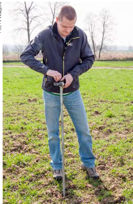
Próbki glebowe pobiera się na różne, ale proste sposoby.