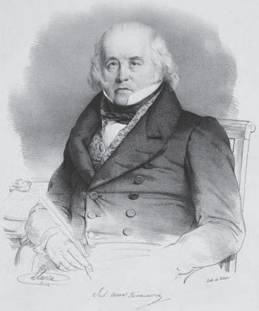
JULIAN URSYN NIEMCEWICZ (I)