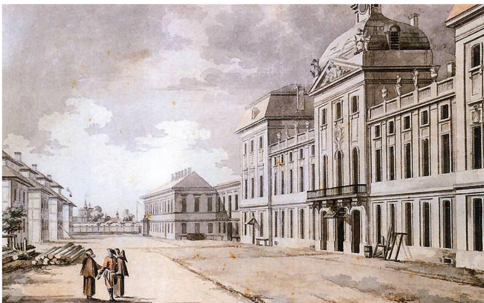
BUDYNEK SZKOŁY RYCERSKIEJ (2)

Niemcewicz wstąpił w szeregi kadetów jako dwunastoletni chłopiec. Kiedy w 1777 r. opuszczał szkolne mury, był już młodzieńcem, ale nie miał chyba pomysłu na to, co począć ze swoim życiem. Podobnie jak wielu kadetów wrócił w rodzinne strony, jednak jak się okazało, nie było mu pisane spokojne życie na prowincji.