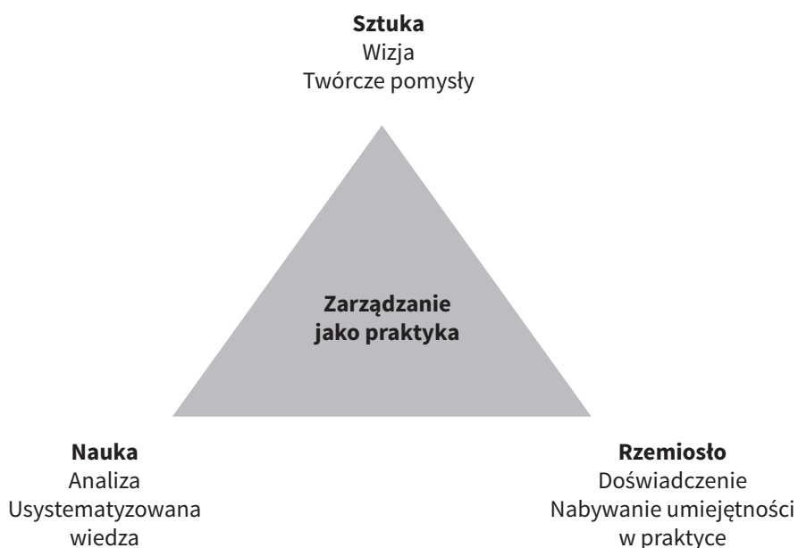
Rysunek 1. Zarządzanie jako sztuka, rzemiosło i nauka

Inne ujęcie akcentuje z kolei, że zarządzanie jest „praktyką, której można się nauczyć głównie z doświadczenia i która jest mocno osadzona w kontekście” (Mintzberg, 2012, s. 27). Na rysunku 1 zaprezentowano zarządzanie jako praktykę opisaną na nauce, rzemiośle i sztuce.