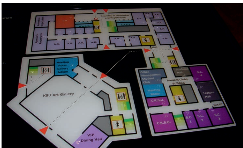
Ryc. 5. Mapa dotykowa galerii sztuki, ułatwiająca orientację w przestrzeni muzealnej osobom z dysfunkcją wzroku, konferencja REHA FOR THE BLIND IN POLAND , Warszawa 2014