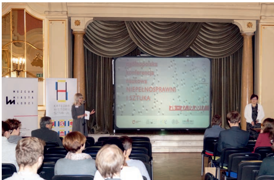
Ryc. 2. Konferencja Niepełnosprawni i sztuka , Łódź 2017