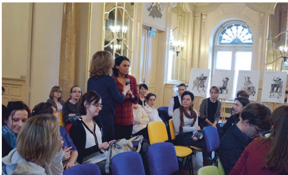
Ryc. 4. Dyskusje warsztatowe z udziałem osób z niepełnosprawnością podczas konferencji Niepełnosprawni i sztuka , Łódź 2017