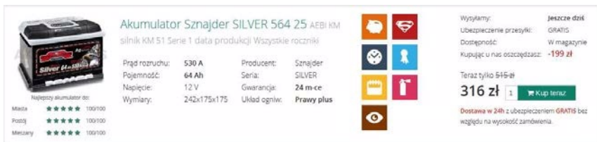
Ilustracja 1.4. Wygląd produktu

Ze względu na brak wiedzy technicznej po stronie klienta chcieliśmy, aby dobór akumulatora był bardzo prosty, a jednocześnie żeby klient miał wybór. Stąd też wpadliśmy na pomysł stworzenia dodatkowych opcji opisujących akumulator pod względem m.in. użytkowania samochodu, np. do jazdy po mieście, do wyjazdów w dłuższe trasy lub w trybie mieszanym.