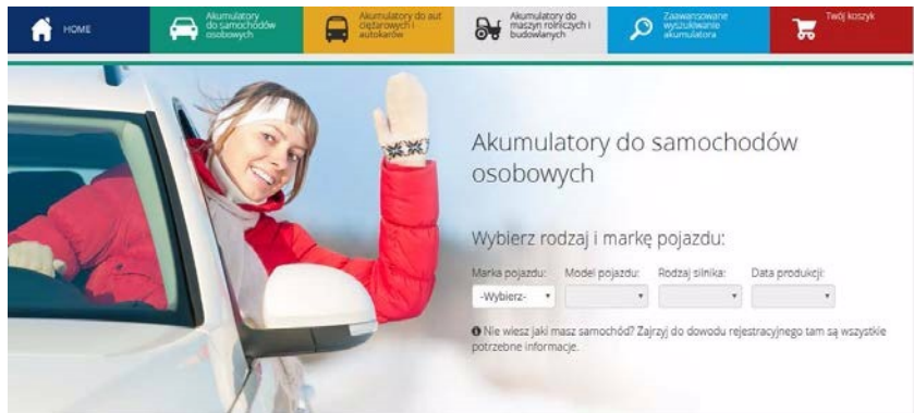
Ilustracja 1.3. Widok wyboru pojazdu