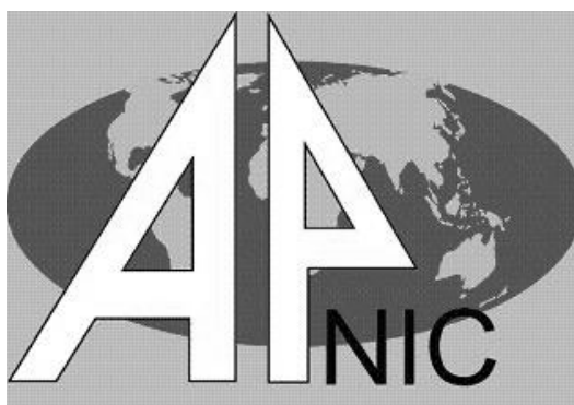
Rysunek 51 - Logo APNIC

W Australii mieści się też Asia Pacific Network Information Centre (APNIC). To regionalna organizacja zarządzająca przydziałem adresów IP na tym obszarze. Forum operacyjnym jest Asia-Pacific Regional Internet Conference on Operational Technologies (APRICOT).