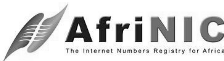
Rysunek 50 - Logo AfriNIC

Organizacją zarządzającą Internetem jest AfriNIC, mieszczący się na Mauritiusie. Zarządza ona przydzielaniem adresów IP dla całego kontynentu. Forum zarządzającym sieciami jest Internet Community of Operational Networking Specialists .