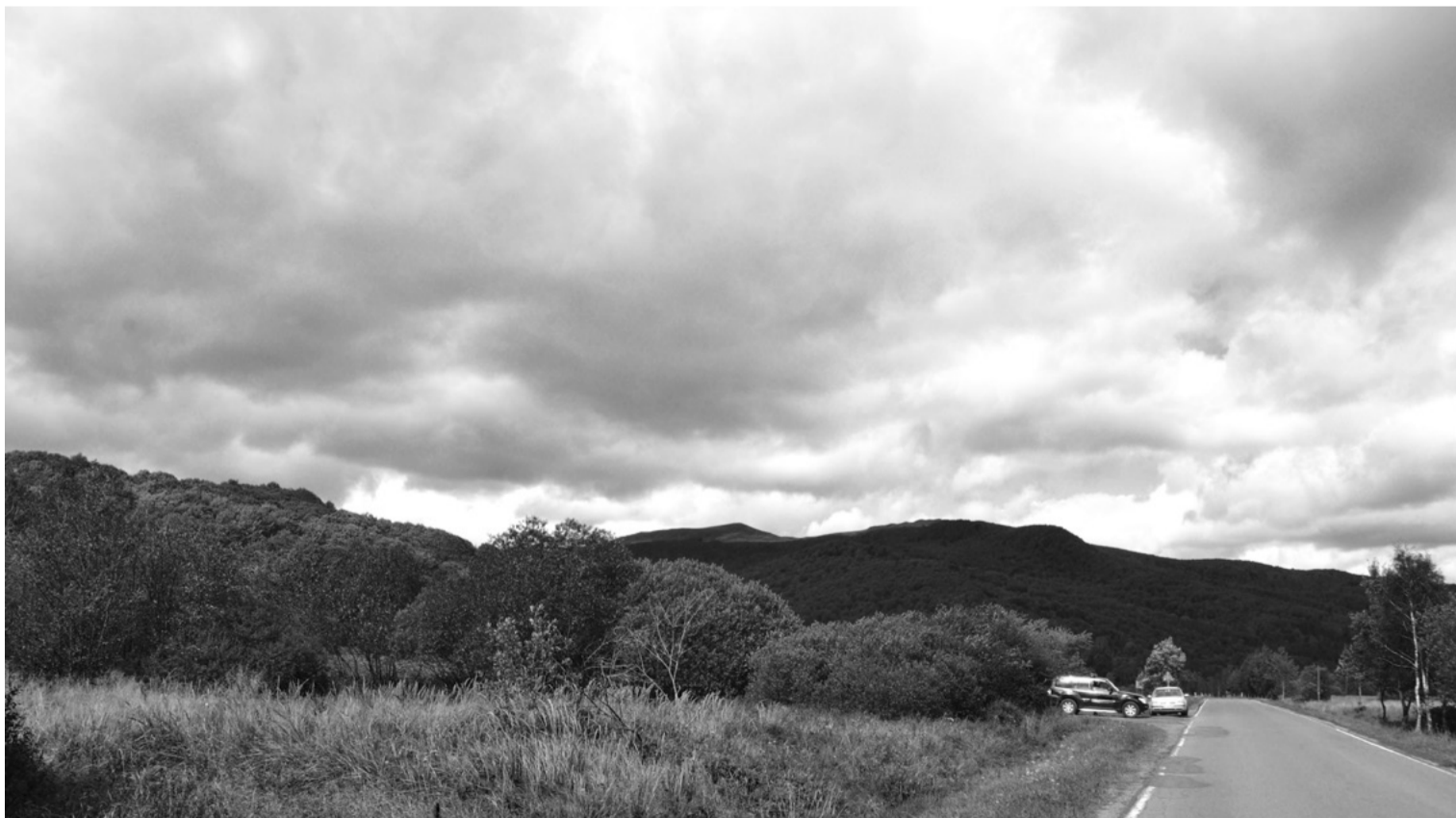
Droga do przełęczy Beskid – widok współczesny