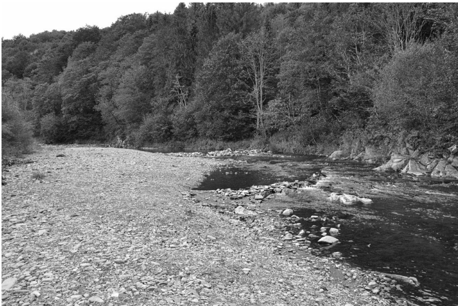
Wołosaty – potok, który od wieków był dla mieszkańców źródłem życia