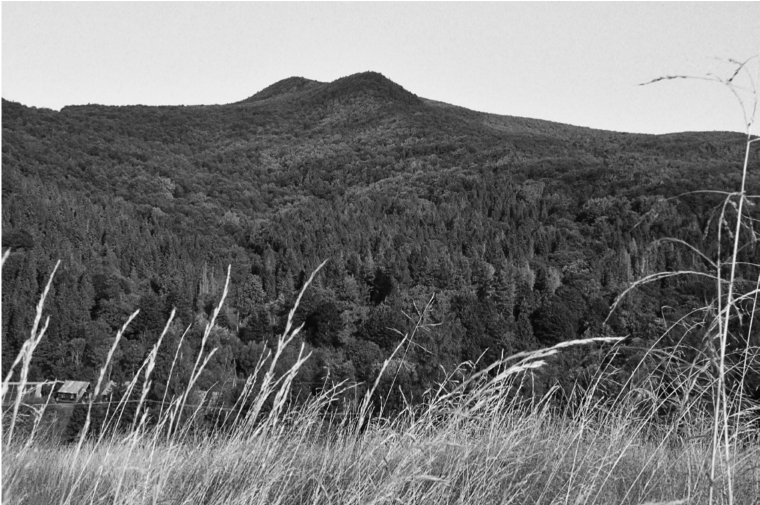
Masyw Połoniny Caryńskiej, czyli to, co w Ustrzykach Górnych niezmiennie od zarania dziejów