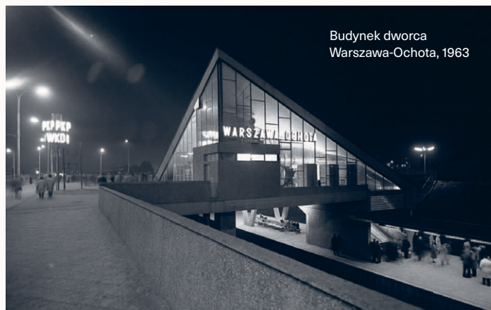
Budynek dworca Warszawa-Ochota, 1963

w latach 70. XX wieku, już po śmierci Szymaniaka. W tym projekcie Romanowicz zastosował niespotykane wtedy rozdzielenie podjazdów dla odjeżdżających i przyjeżdżających przez wykorzystanie różnych poziomów (dziś takie rozwiązanie sprawdza się w portach lotniczych). Do budowy tego dworca użyto 50 tysięcy m 2 kamienia, w tym 6 tysięcy m 2 marmuru. Całej bryle nadał Romanowicz kształt przeskalowanej wiaty przystankowej, której aż dwie trzecie schowano pod ziemią.