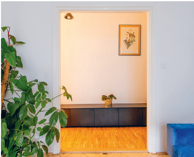
Od góry: Kuchnia ——— — Sypialnia Eweliny z drewnianą szafą po poprzednim właścicielu. Za kotarą mieści się wnęka na sprzęty gospodarcze ——— — Stolik w sypialni ——— — Widok na przedpokój z salonu