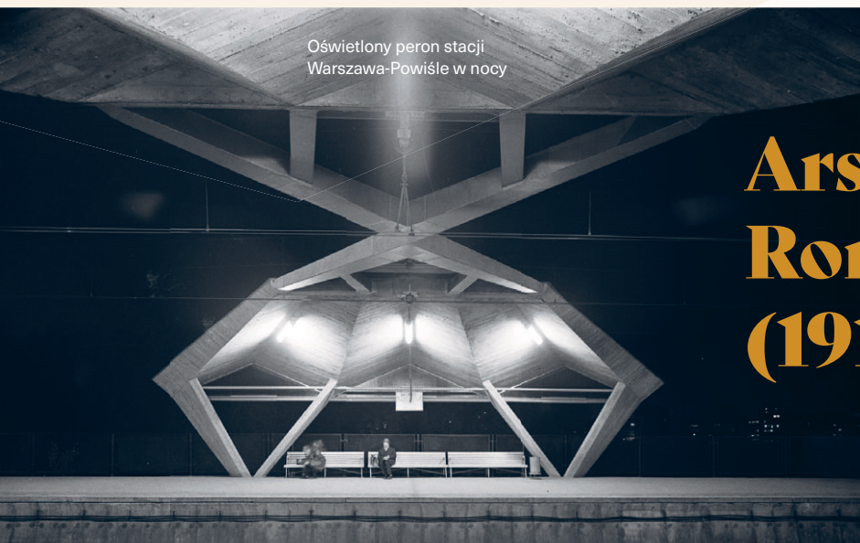
Oświetlony peron stacji Warszawa-Powisłe w nocy

Gdy miał raptem 28 lat, razem z Jackiem Szweminem zaprojektował budynek restauracji na Gubałówce. Zarówno ten, jak i inne obiekty, takie jak kolej linowa na Kasprowy Wierch, obserwatorium Instytutu Meteorologicznego czy hotel na Kalatówkach, budowano w ekspresowym tempie z myślą o zawodach mistrzostw świata FIS w narciarstwie klasycznym, rozegranych na pół roku przed II wojną światową.