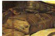
Czytanie z Księgi proroka Barucha

DRUGA NIEDZIELA ADWENTU • Rok C • KOLOR: fioletowy • KOLEKTA: Modlimy się, aby troski doczesne nie przeszkadzały nam w dążeniu na spotkanie z Chrystusem , lecz nadprzyrodzona mądrość kształtowała nasze czyny • CZYTANIA: W tę niedzielę zawsze słuchamy Ewangelii o działalności Jana Chrzciciela • Księga Barucha 5,1–9 • Psalm 126,1–6 • List św. Pawła do Filipian 1,4–6.8–11 • Ewangelia wg św. Łukasza 3,1–6