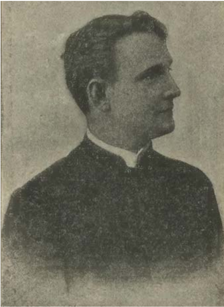
Ilustracja 1. Antoni Szandlerowski w młodości