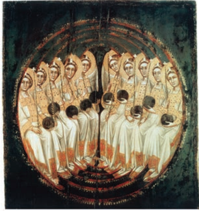
Гварентио ди Арно: Хор Господств, 1345.

объяснении мира является излишней. Однако одновременно с этим в различных науках накапливаются загадочные явления, которые нельзя объяснить с помощью общепринятых материалистических концепций и которые, как правило, откладываются в ящик с наклейкой «случайность».