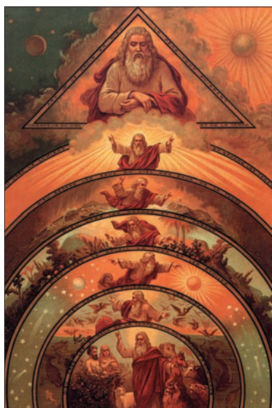
Семь дней творения, XIX век.

На этих курсах ведется работа с творческим воображением, но они имеют один недостаток. Они больше ищут приятные душевные состояния и представления, чем истину, и не задают себе вопроса: соответствуют ли эти видения прекрасных существ чему-то реальному, или они существуют лишь в моей голове? Как мне отличить настоящее откровение от фантазии?