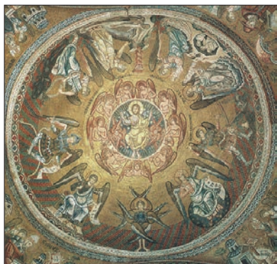
Девять ангельских хоров и их характерные деяния. Купол собора св. Марка, Венеция, XIII век.

ла не в результате «Большого взрыва», но возвышенные сущности, прообразы добродетелей, пропели, вымолвили ее как произведение искусства. Природа была живой, одушевленной, осмысленной, – а вовсе не машиной или цепной химической реакцией. Человек был не побочным продуктом гонки вооружений между эгоистичными генами, а венцом творения.