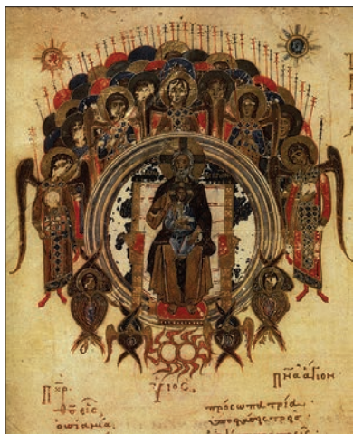
Бог Отец как Ветхий днями в окружении ангельских хоров. Греческая иллюстрация XII века.

Как великие духи времени архангелы чередуются в периодах по 354 года, о которых говорит Тритемий. Их очередь приходит каждые 7 \times 354,3 = 2480 лет. Последовательность великих духов времени, однако, иная. Если мы представим себе планетные сферы как семь тонов небесной гаммы, то эта последовательность образует в музыке сфер квинтовый круг: Орифиил, Анаил, Захариил, Рафаил, Самаил, Гавриил, Михаил. Об этом великом круге говорил и Будда, когда провозглашал, что великое колесо дхармы оборачивается один раз за 25 веков и в каждом цикле приходит один новый будда. Геродот намекает, что египтяне знали об этом круге уже в архаический период.