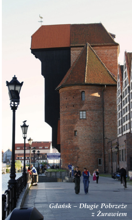
Gdańsk – Długie Pobrzeże z Żurawiem

TRÓJMIASTO to aglomeracja położona na północy Polski nad Zatoką Gdańską w województwie pomorskim. Od 28 marca 2007 roku Trójmiasto przestało być wyłącznie pojęciem potocznym, a stało się obszarem udokumentowanym za sprawą Karty Trójmiasta mówiącej o konieczności wzajemnej współpracy miast Gdyni, Gdańska i Sopotu w ramach rozwoju aglomeracji trójmiejskiej. Miasta te stanowią jeden z ważniejszych ośrodków przemysłowych, naukowych i kulturalnych w kraju.