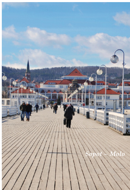
Sopot – Molo