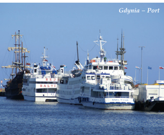
Gdynia – Port