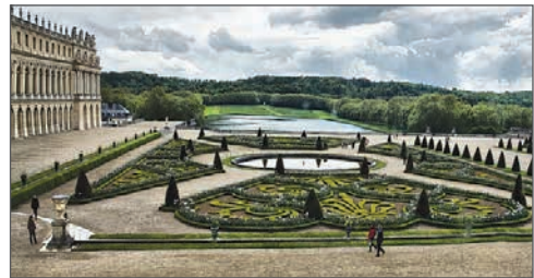
Версальський парк. XVII ст. Франція

Предметами зображення в мистецтві є природні об'єкти, внутрішній світ людини, її почуття, важливі для неї події особистого чи суспільного життя, побут, традиції тощо, а специфічною формою відображення дійсності — художній образ , який виявляє загальне через конкретне, індивідуальне. Тобто, митець творчо переосмислює дійсність і, використовуючи художню мову, способи зображення та засоби виразності