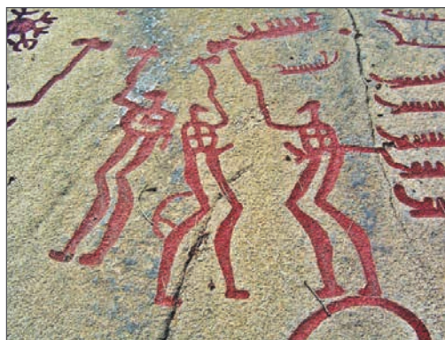
Ритуальний танок. Наскельний рельєф у Танумі. 1700–500 рр. до н. е. Швеція

Окрім цього, стародавні люди знаходили час для ритуальних співів і танців, основу яких складали рухи, що імітували поведінку тварин, мисливські та військові вправи. Подібні заняття для наших предків були водночас і магічним обрядом, і актом пізнання, і засобом передачі досвіду та згуртування колективу.