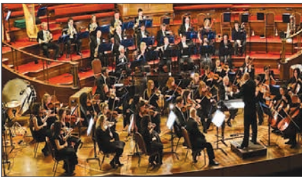
Лондонський симфонічний оркестр. Заснований 1904 р.