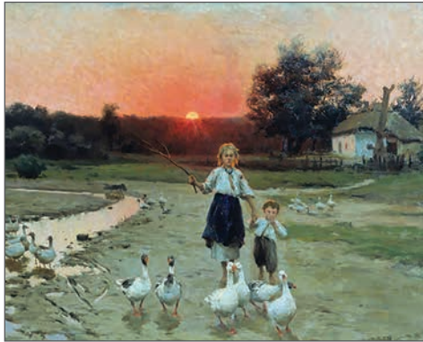
М. Пимоненко. «Вечоріє». 1900 р.