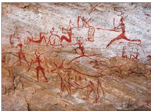
Наскельний малюнок у печері Шове. Бл. 30 тис. років до н. е. Франція

Мистецтво як особливий вид людської діяльності зародилося ще в добу палеоліту. Наші печерні предки, незважаючи на щоденну сувору боротьбу за виживання, захоплювалися красою довкілля, багатством та різноманітністю природних форм і намагалися відтворити їх у рисунках доступними засобами. Давні художники використовували гострі камінці для продряпування на скелях або вуглилки від вогнища, природні мінеральні фарби для контурних чи силуетних зображень тварин на стінах печер. Фарбу наносили пальцями або примітивними пензлями (жмут вовни, пучок трави). Пізніше в наскельних малюнках почали з'являтися зображення людей, багатофігурні композиції — зокрема, сцени полювання. Із глибини віків до нас дійшли й висічені з каменю скульптури тварин, рельєфи, гравюри на кістках і рогах упольованих звірів.