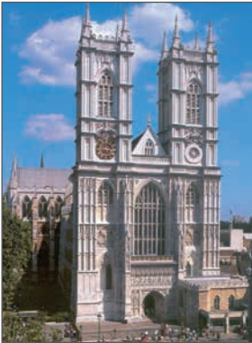
Вестмінстерське абатство. 1245–1745 рр. Лондон

Розгляньте ілюстрації. Які види мистецтва на них зображено? Обґрунтуйте свою думку.