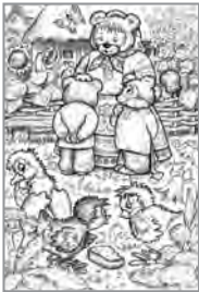
В. Басалига. Ілюстрація до казки «Брати ведмедики»

Уяви себе на художній виставці, де представлені роботи на тему «Літо». Знайди серед цих творів олійний живопис, акварельний живопис та графіку. Які кольори використали митці, зображуючи літню природу?