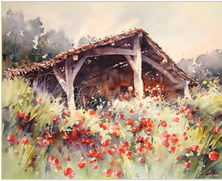
К. Гранью. «Пейзаж»