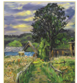
В. Шморгун. «Дуб навпроти сонця»