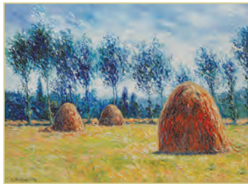
К. Моне. «Копиці сіна в Живерні»