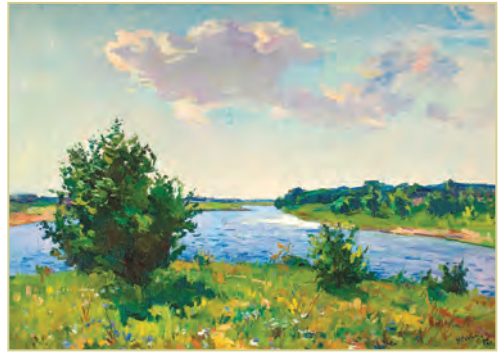
М. Гантман. «Літо»