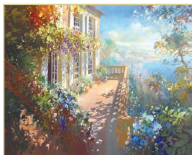
Л. Парсельє. Пейзаж