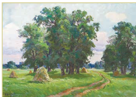
В. Непійпиво. «Серпень»

Подивись, як художники зображують літо. Які кольори використали митці у своїх творах?