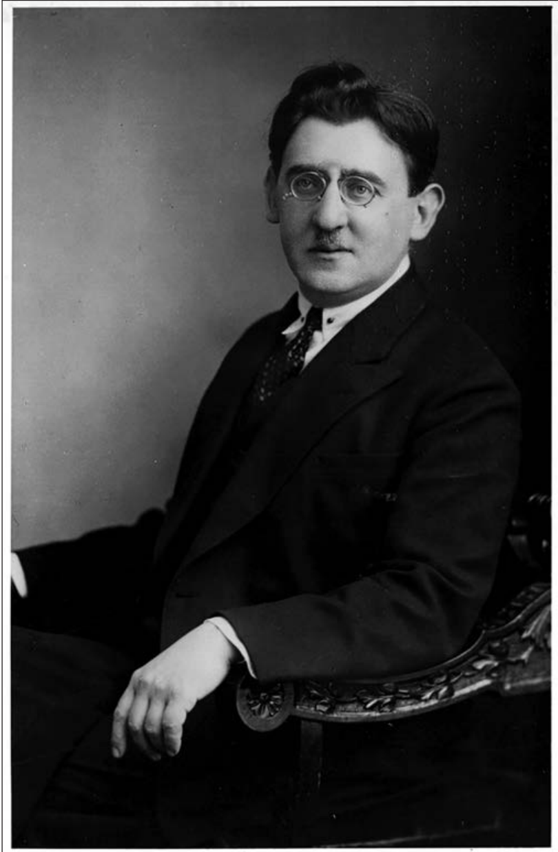
Яків Ісидорович Перельман Фото 1929 р. (Barron Hilton Pioneers of Flight Gallery) 1)