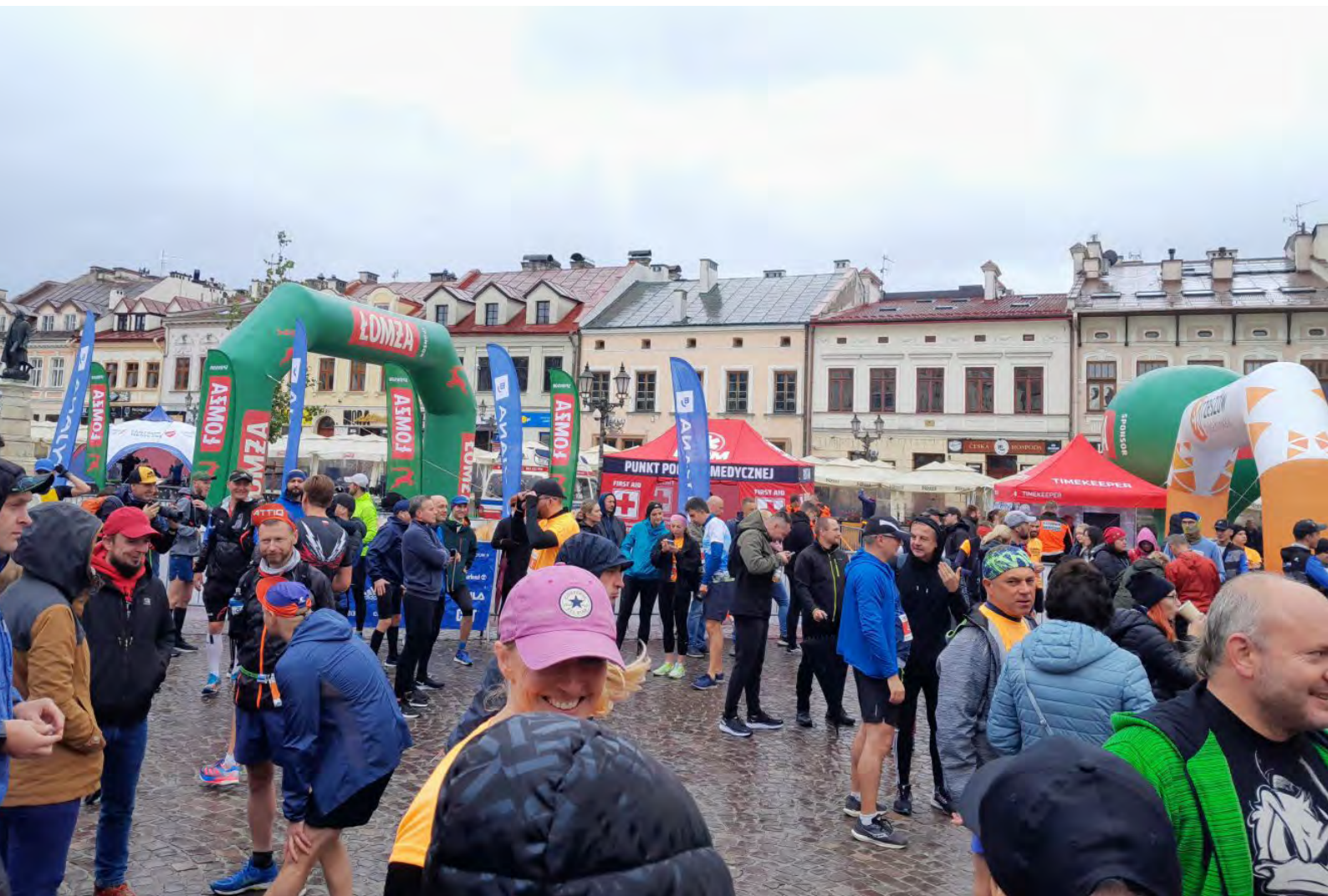
Fot.4. Dopiero niedługo, czyli tuż przed startem na Rynku rzeszowskim zrobiło się gwaro i tłumnio, bo zaczęli się nagle pojawiać zawodnicy i kibice

W dniu startu 2.10 w niedzielę, początkowo plac przed Ratuszem w centrum Rzeszowa święcił pustkami i minęło trochę czasu zanim przybyli pierwsi zawodnicy, kibice i reszta mieszkańców, którzy interesują się takimi imprezami.