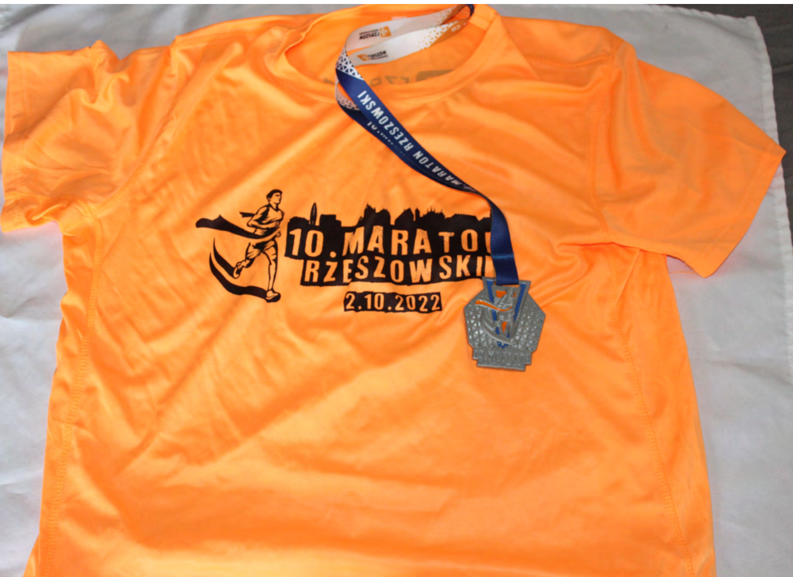
Fot.1. Trofea po biegu: medal i koszulka