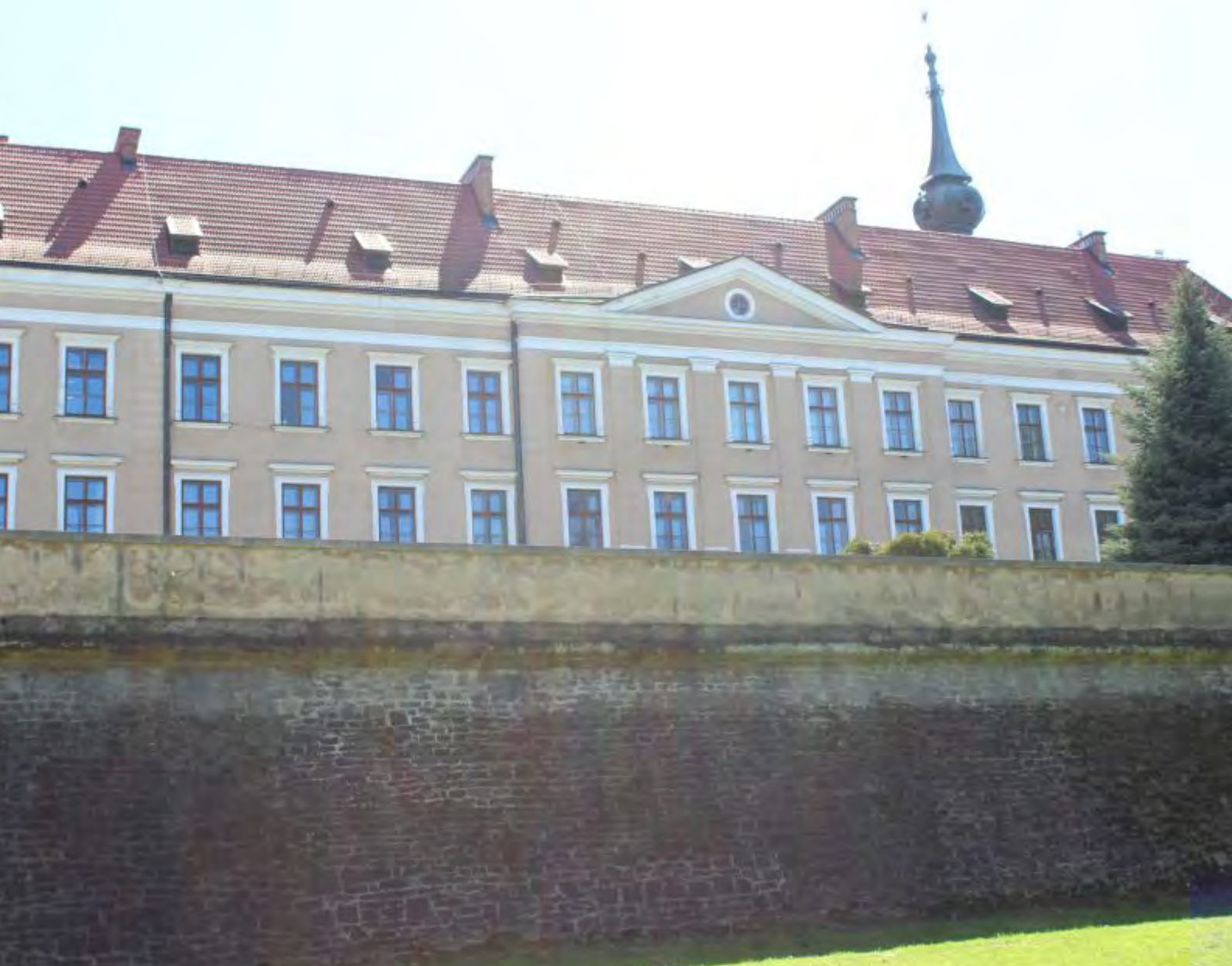
Fot.8. Po obiegnięciu murów Zamku Lubomirskich skręciliśmy w ulicę Dąbrowskiego

I wtedy, już bardzo wyraźnie, poczułem wiatr. Przyznam się, że tak trochę z niedowierzaniem słuchałem przed startem informacji o tym, że wieje, gdyż w tym samym roku miałem już na koncie przebiegnięty maraton w Gdańsku (poświęciłem temu wydarzeniu jedno z moich opracowań) w kwietniu i miałem wrażenie, że to tam dopiero wiało od morza. Ale i podkarpacki wiatr też dał się nam we znaki. Odcinek biegnący wzdłuż ulicy Dąbrowskiego (a pokonaliśmy go dwa razy) był jednym z dłuższych i pamiętam, że wiało nam w twarz utrudniając bieg. Potem skręciliśmy na wschód w Al. Powstańców Warszawy, aby po ominięciu Politechniki Rzeszowskiej skierować się teraz na północ i wbiec w ulicę Hetmańską. Teraz wiało, ale w plecy. I to też okazał się być jeden z dłuższych odcinków biegu, który zakończył się skrętem w ulicę Bulwarową.