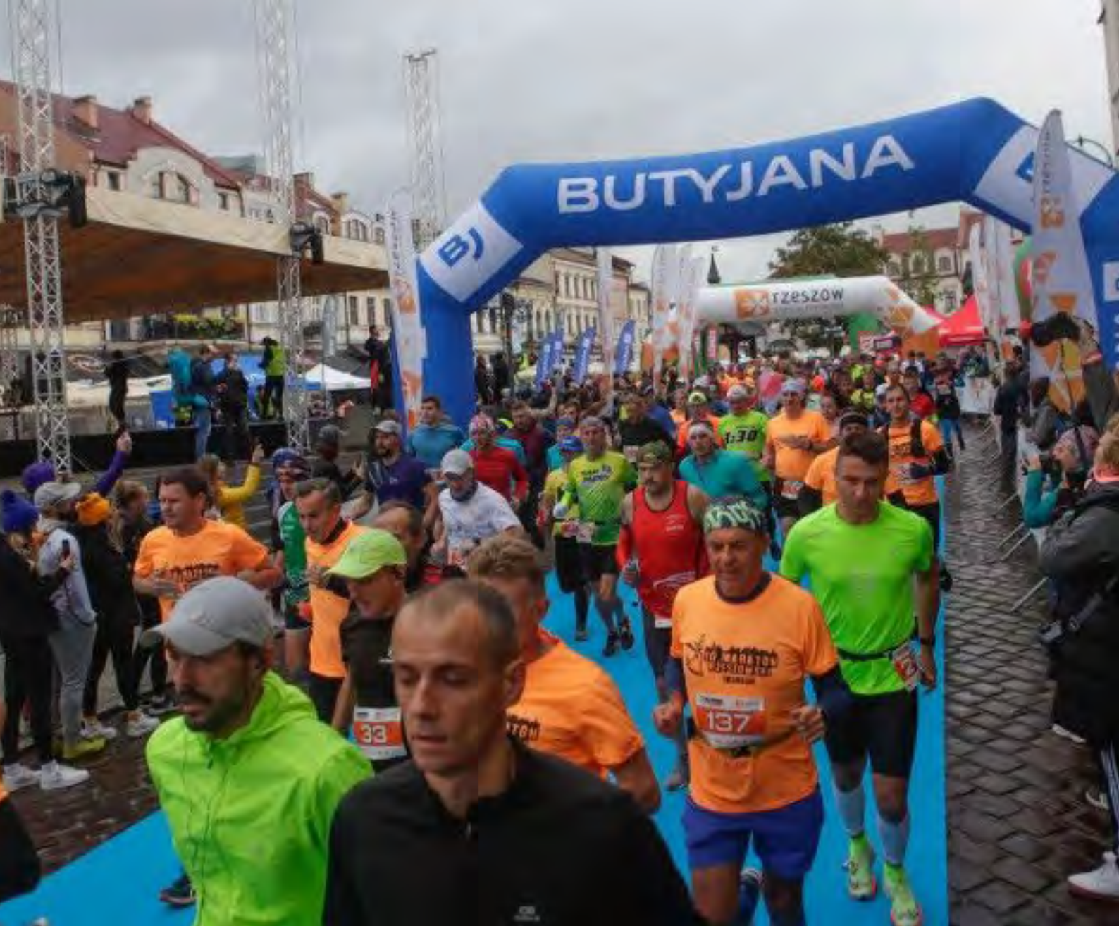
Fot. 6. Ujęcie z przodu tuż po rozpoczęciu biegu (po lewej stronie widoczna scena, na której udekorowano zwycięzców po zakończeniu biegu)

Tam była również meta, ale wcześniej półmetek, bo w maratonie 10 edycji musieliśmy pokonać dwie pętle. Po starcie z Rynku pobiegliśmy ulicą Kościuszki następnie przez Plac Farny, ulicę Sokoła a na rondzie wieńczącym ulicę ks. Jałowego, skręciliśmy w Jana III Sobieskiego.