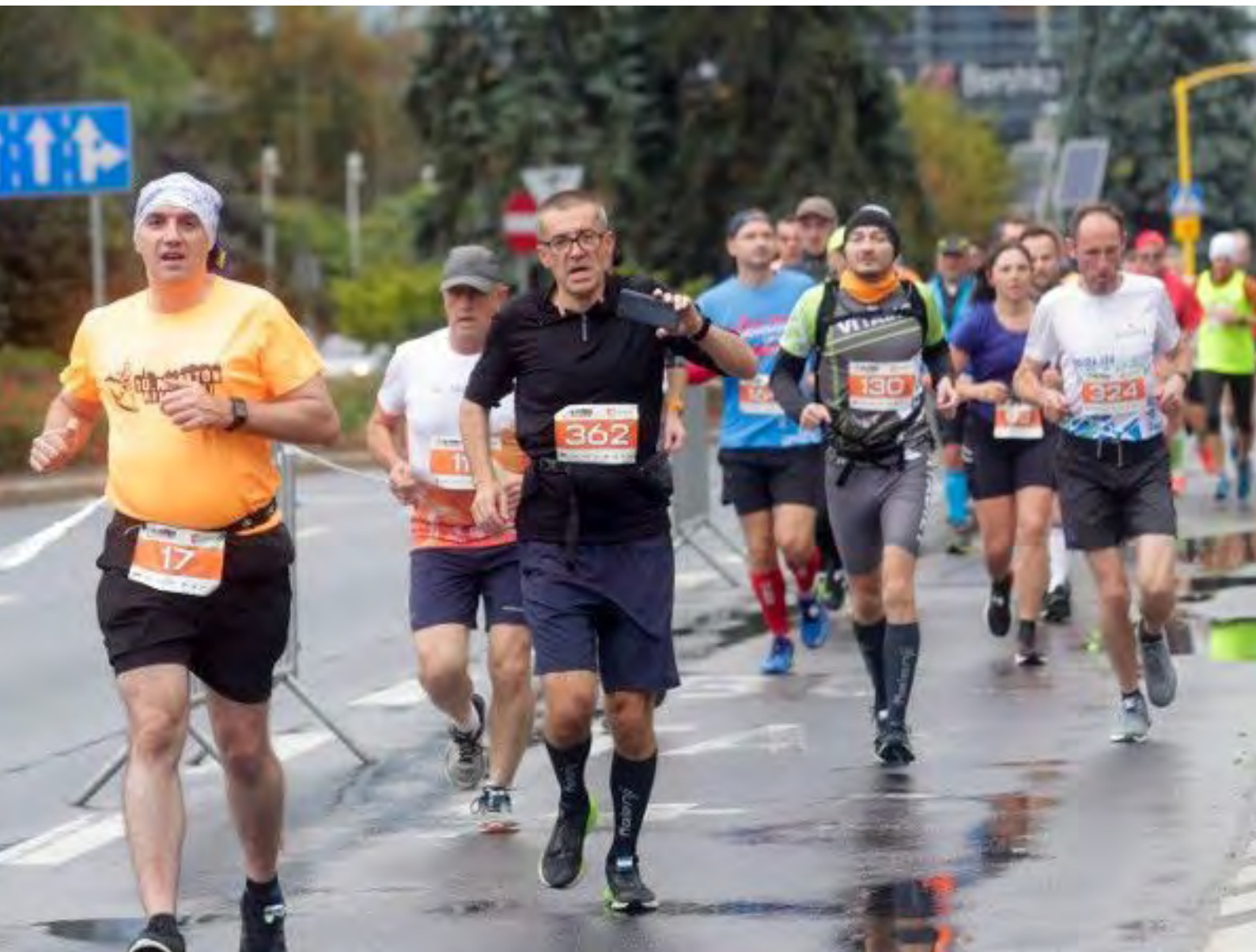
Fot.7. Po przebiegnięciu ul. Piłsudskiego dobiegliśmy do Ronda im. R. Dmowskiego po czym skręciliśmy w Al. Ł. Cieplickiego (autor po lewej z numerem startowym 17)

Kojarzę, że później widziałem już tylko „pace maker-ów” w koszulkach z oznaczeniem czasu na plecach, bez baloników, gdyż te chyba ze względu na wiatr (o czym jeszcze wspomnę) musiały się zerwać i zniknąć na niebie.