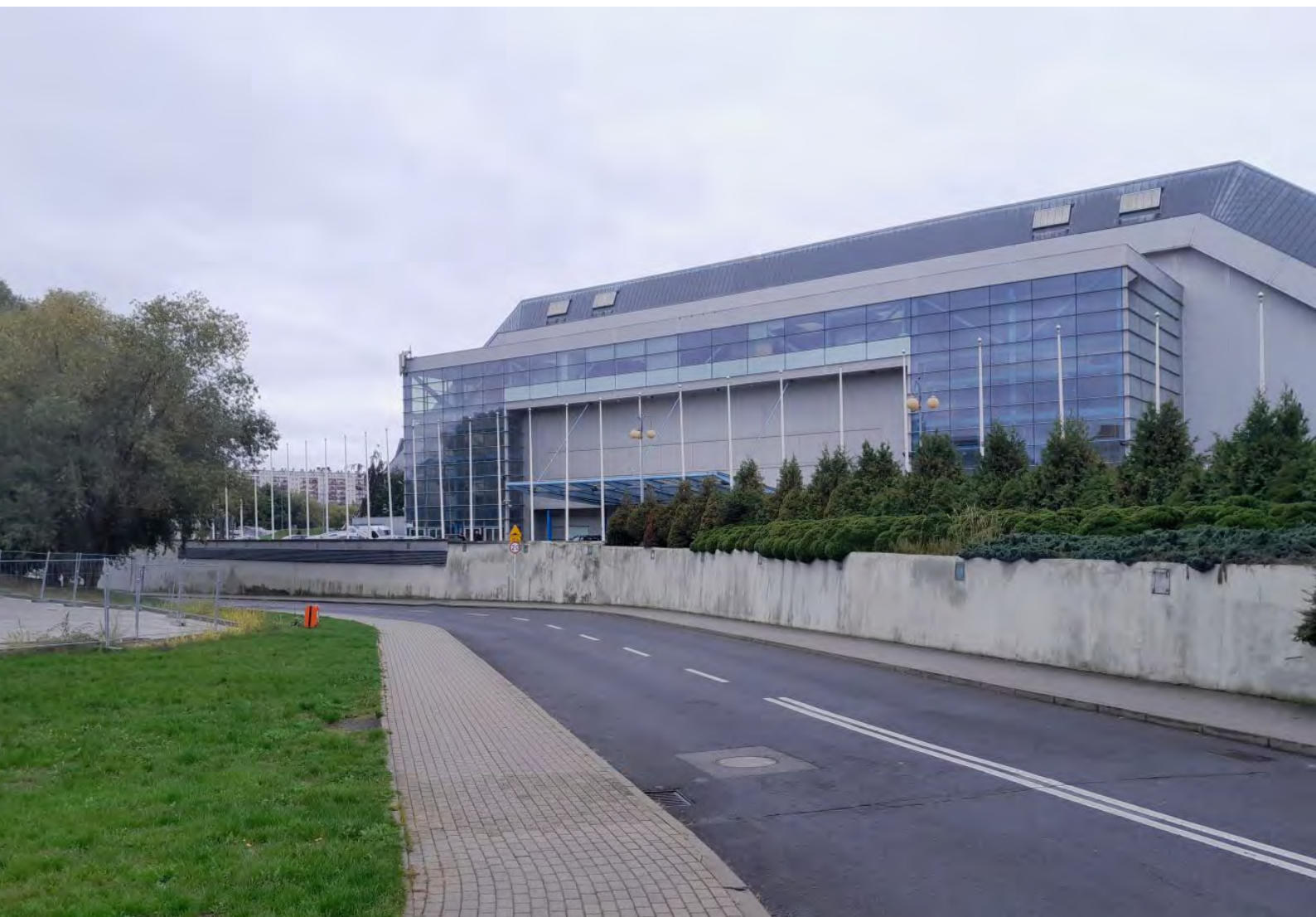
Fot.3. Biuro zawodów mieściło się przy ulicy Podpromie 10

Choć miałem kilka zawirowań w życiu (i nie były to kwestie zdrowotne), a nawet musiałem zupełnie przerwać przygotowania a potem ograniczyć je do minimum na kilkanaście tygodni przed biegiem, czyli w momencie kluczowym przed startem (uważam, że jest to co najmniej 3-2 miesiące), to mimo wszystko zapisałem się i przyjechałem 1.10 po odbiór pakietu startowego.