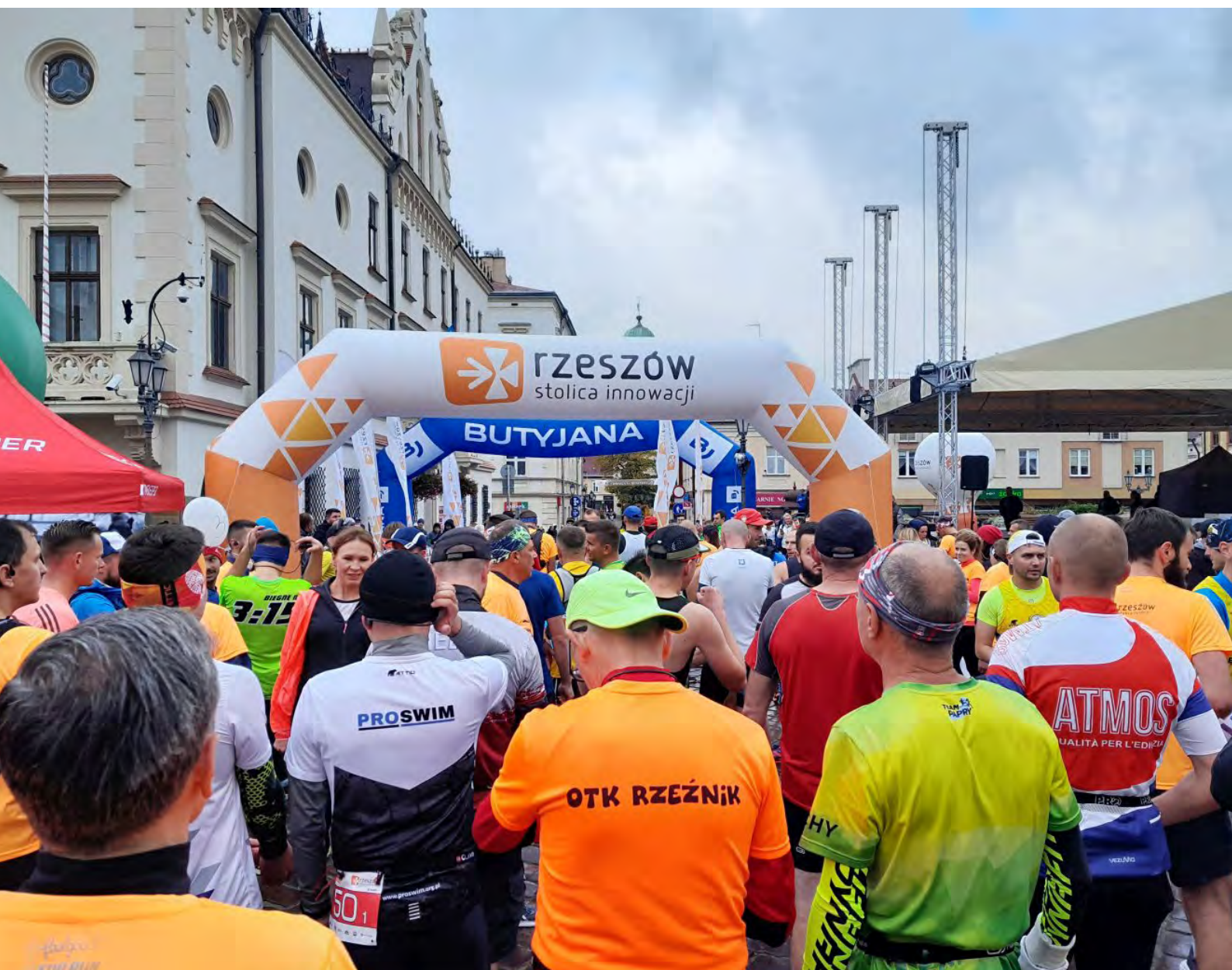
Fot.5. Jak widać na zdjęciu biegacze reprezentowali wiele różnych klubów (po lewej stronie, tuż przed budynkiem Ratusza, widać nieco przysłoniętą, seledynową koszulkę „zającą” który miał doprowadzić biegaczy z czasem 3:15 do mety)

W sumie (według listy startowej) było nas - maratończyków niecałe 400 osób, natomiast wraz z uczestnikami sztafet wszystkich biegaczy, jak podał organizator, było około 700 osób. Pogoda była niepewna, bo choć temperatura wynosiła 11 stopni a więc idealnie jak na maraton, niebo było prawie całkowicie pokryte chmurami. Ostatecznie podczas biegu, nie było deszczu (padało i to sporo w noc poprzedzającą maraton). Po kilku informacjach dotyczących trasy, zawodników (przybyli nawet m.in. biegacze np. ze Śląska – a dokładnie tego samego dnia czyli 2.10 startowała też 14 edycja Silesia Marathon – wśród moich opracowań też można znaleźć opis tego biegu, który prowadził wyjątkową trasą, podczas której biegliśmy przez cztery śląskie miasta) zaczęło się odliczanie i punktualnie o 9.30 wystartowaliśmy sprzed Ratusza.