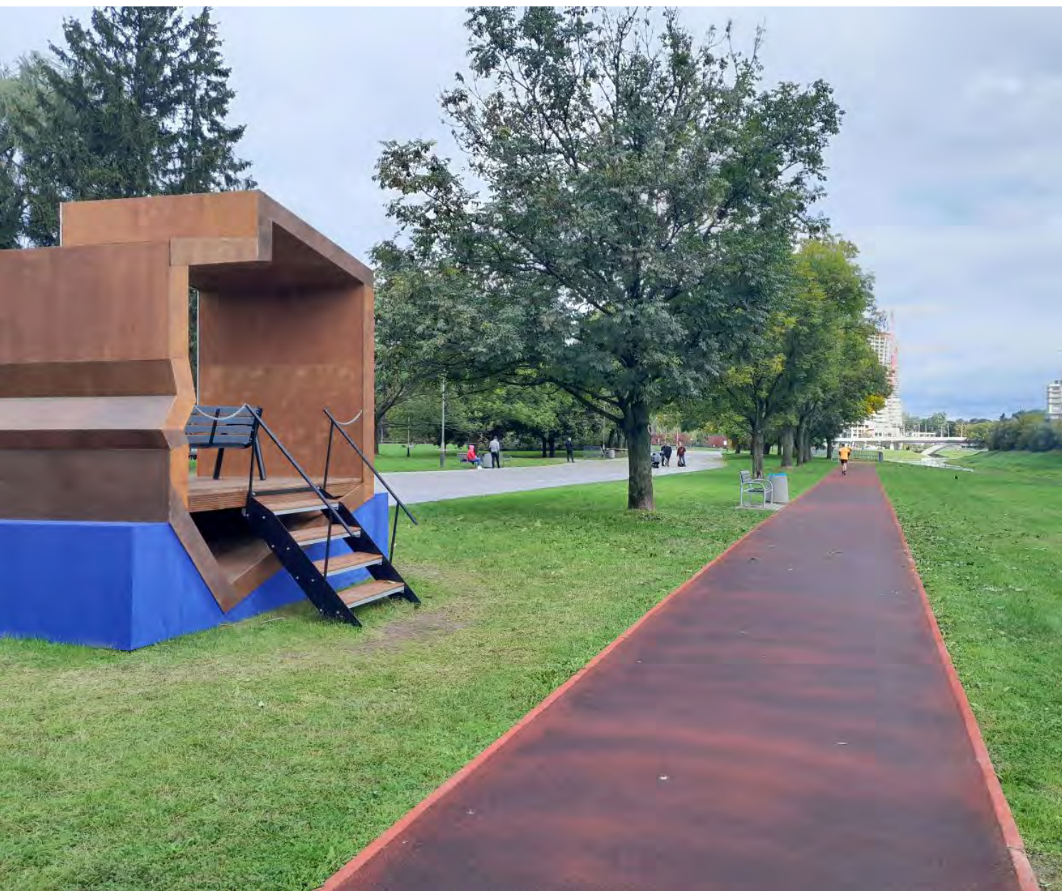
Fot. 9. Po ponownym dobiegnięciu do Mostu Karpackiego i po przekroczeniu go (trasa biegła pod nim) zbliżyliśmy się do krótkiego odcinka biegnącego po tartanie (zdjęcie pokazuje też „propagandową ławkę” – po lewej – podobno już nie istnieje, bo nie wytrzymała warunków pogodowych)

Kiedy po nawrocie do nich dołączyłem, rzeka pojawiła się teraz po mojej prawej stronie. Od czasu do czasu zrywał się wiatr, ale przecierało się słońce. Momentami było nawet zbyt ciepło, ale ciągle jeszcze nie gorąco.