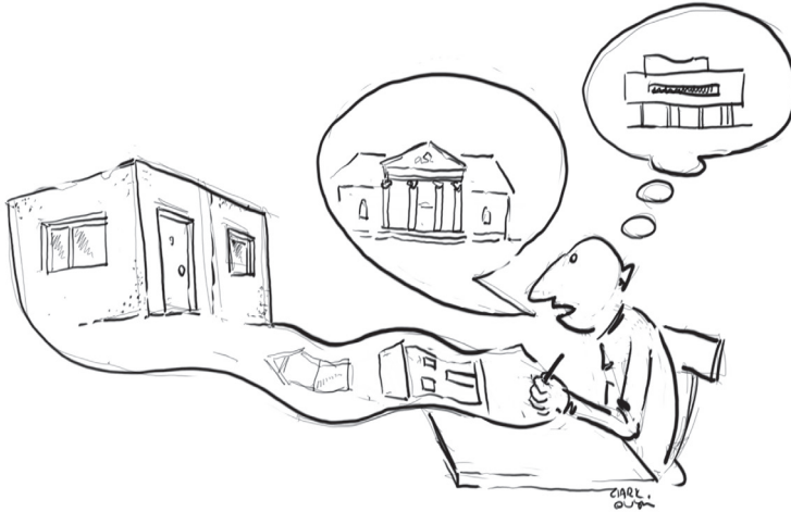
1. „Słowo architekta” (rys. Błażej Ciarkowski)

upadku komunizmu 9 . Słowo architekta wchodzi w empatyczną relację z „obrazem pobitego przodka” – kłopotliwego dziedzictwa architektury PRL-u, poszukując w jego krytycznej analizie wartości poznawczych dla teraźniejszości.