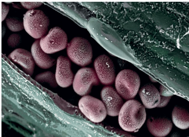
Jedno ze zdjęć wykonanych przez Andrew Paula Leonarda.