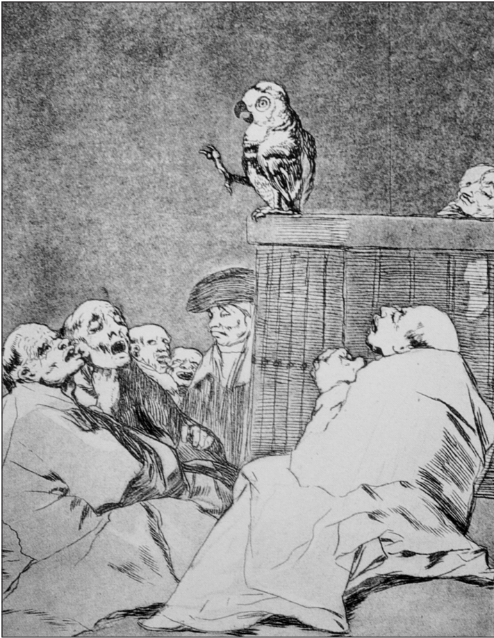
Francisco Goya y Lucientes, Złotousty ( Que pico de Oro! )

Wygląda to trochę na wykład uniwersytecki. Może papuga mówi o medycynie? W każdym razie, nie wierz ani słowu.