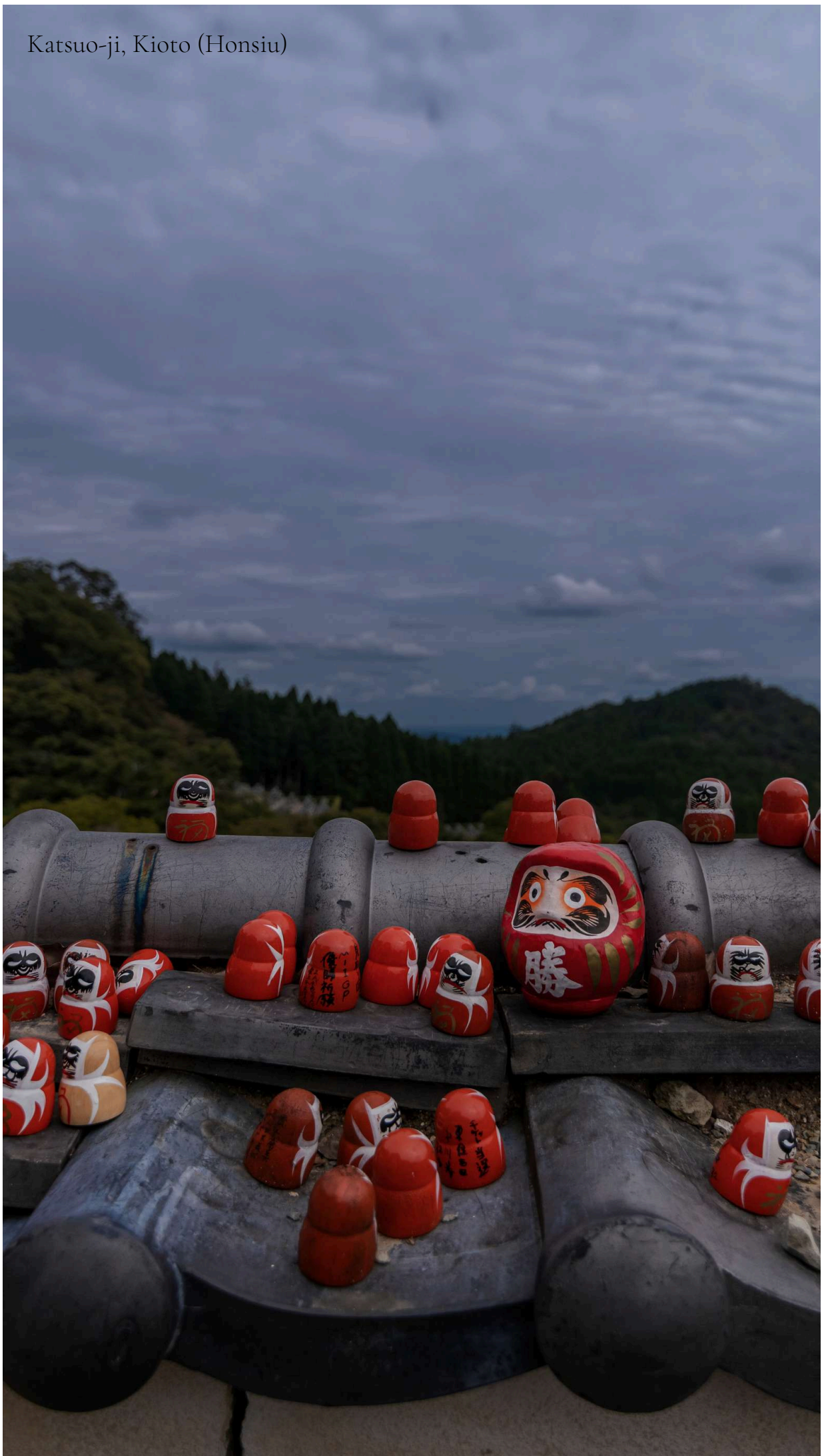
Katsuo-ji, Kyoto (Honsiu)