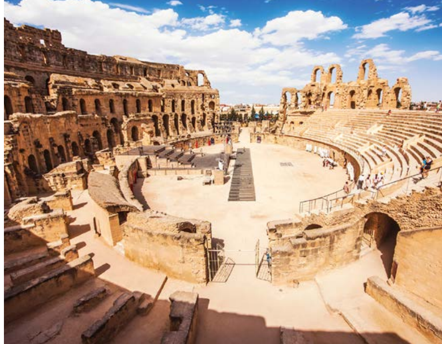
■ Amfiteatr w Al-Dżamm mógł pomieścić nawet 30 tys. widzów

W XX w. w ruinach amfiteatru rozpoczęto prace archeologiczne. Obiekt odrestaurowano, a w 1979 r. został on wpisany na listę światowego dziedzictwa kulturowego i przyrodniczego UNESCO i stał się jedną z głównych atrakcji turystycznych Tunezji, dzięki czemu zapomniane Al-Dżamm zaczęło przyciągać tysiące