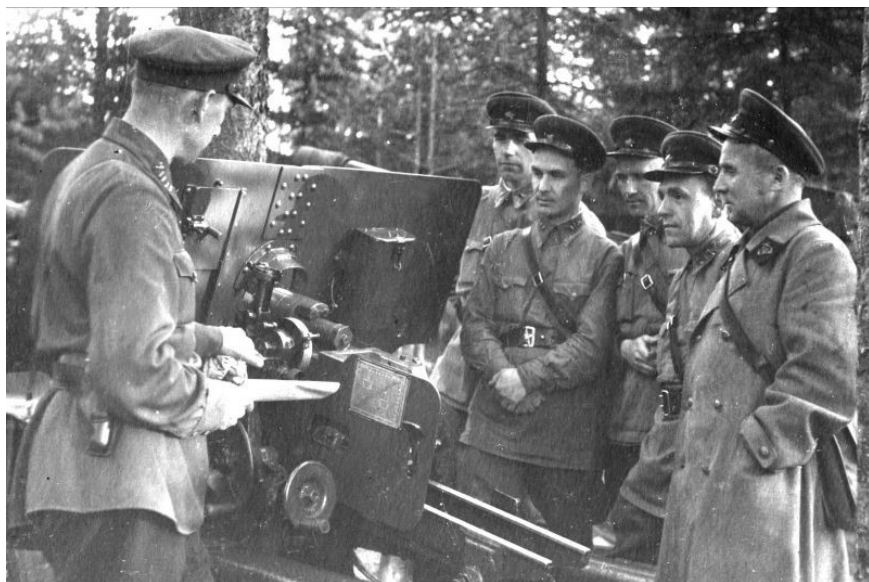
Radzieccy oficerowie podczas ćwiczeń w 1942 r. – Front Leningradzki

Opierając się na powyższym, przyjmuję w niniejszej pracy założenie oparte na konsensusie, że Armia Czerwona nie szykowała się do agresji na III Rzeszę latem 1941 roku, zaś wszystkie podejmowane działania miały charakter obronny, zgodny z radziecką doktryną działań obronnych, która zakładała przeniesienie walk na terytorium przeciwnika.