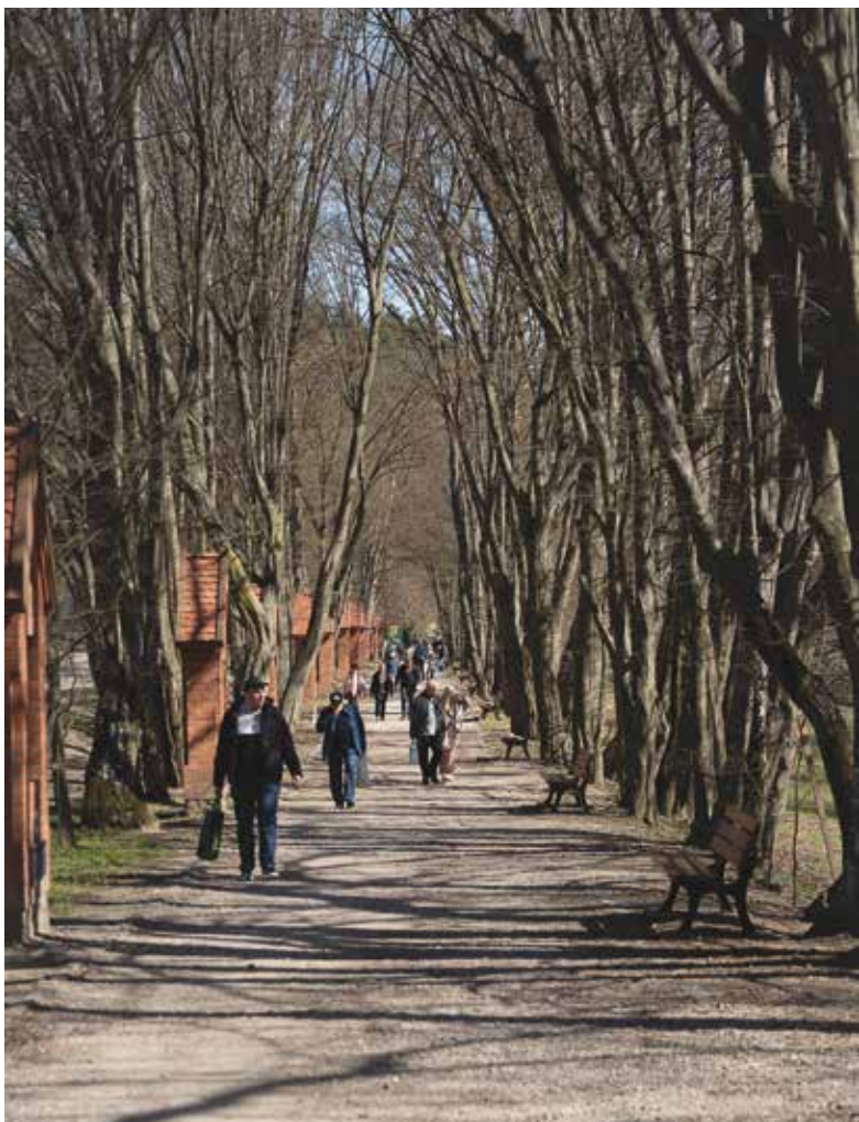
Do cudownego źródła prowadzi grabowa aleja