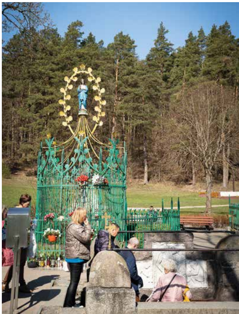
Cudowne źródło z figurą Matki Bożej Niepokalanie Poczętej