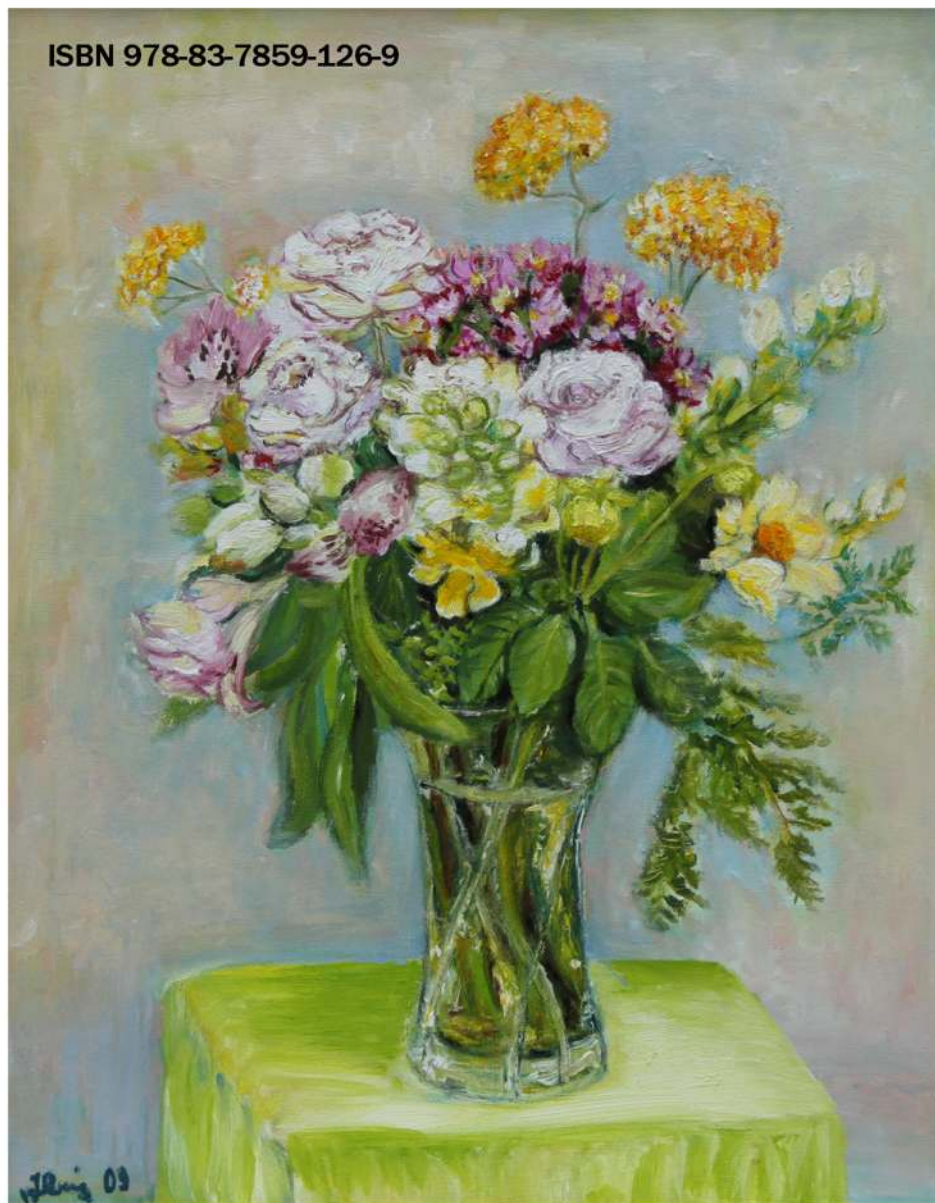
Kwiaty z mojego ogródka