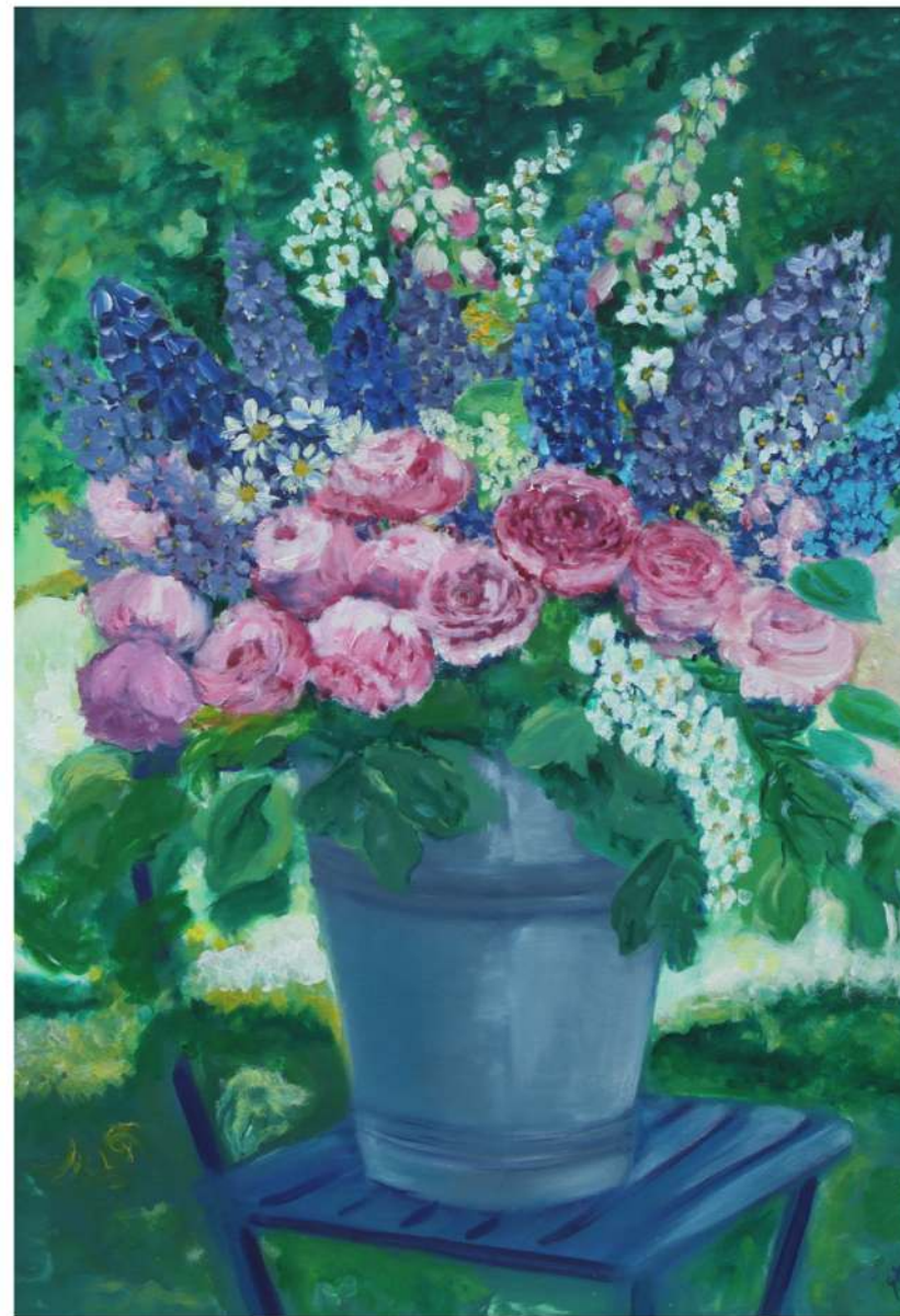
Wiaderko z kwiatami