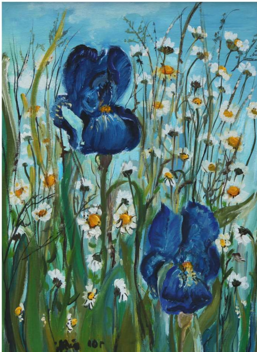
Irysy i margaretki